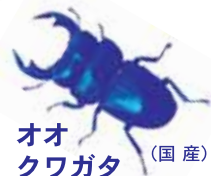
オオクワガタ (国産)