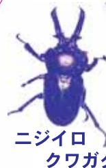
ニジイロクワガタ