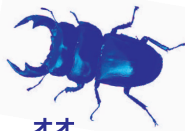
オオクワガタ (国産)