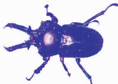
ニジイロクワガタ